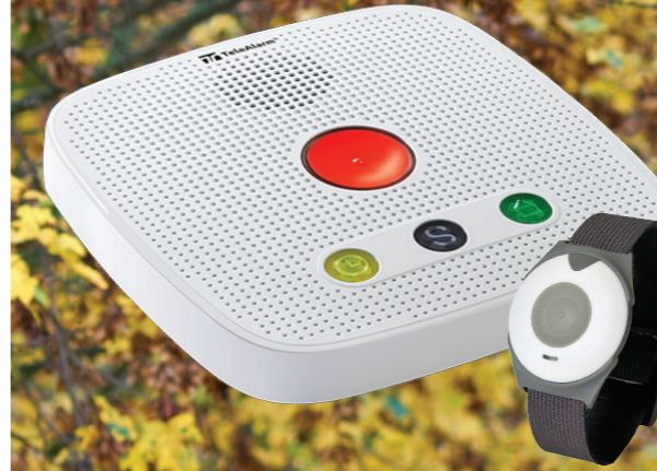
Der klassische Hausnotruf